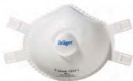
Dräger X-plore 1330 FFP3